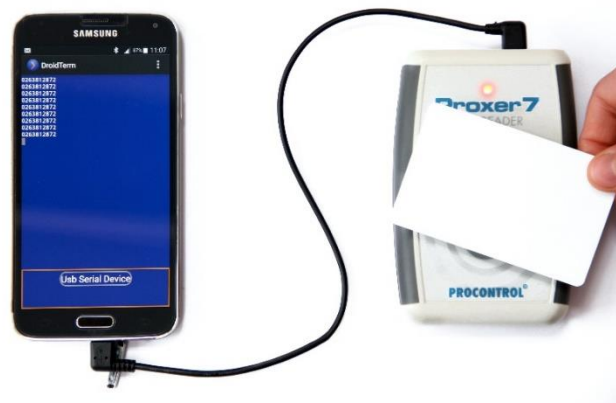
USB soros port / billentyűzet emuláció, kártyaolvasás okostelefonba speciális OTG kábellel