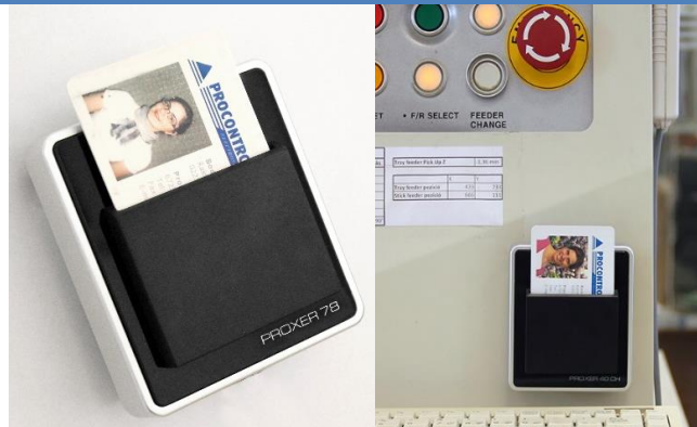
Exkluzív, üveglőlapos fali / gép oldalára szerelhető kivitel, IP54 és IP65 védettségű változatban is