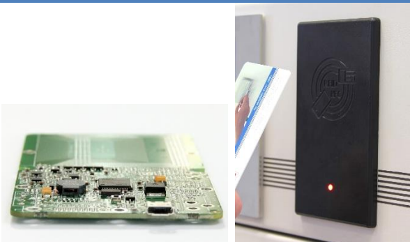
Opcionális Proxer7 allreader előlap elérhető