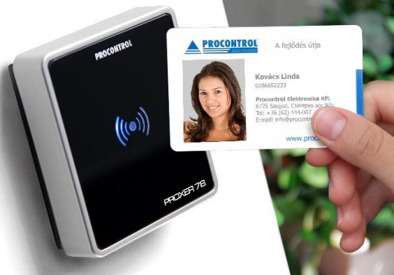
Exkluzív, üveglőlapos fali / gép oldalára szerelhető kivitelű tokozás, IP54 és IP65 védettségű változatban is