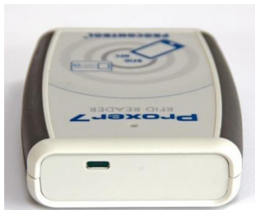
Asztali alapkivitel, felső kábelkivezetéssel