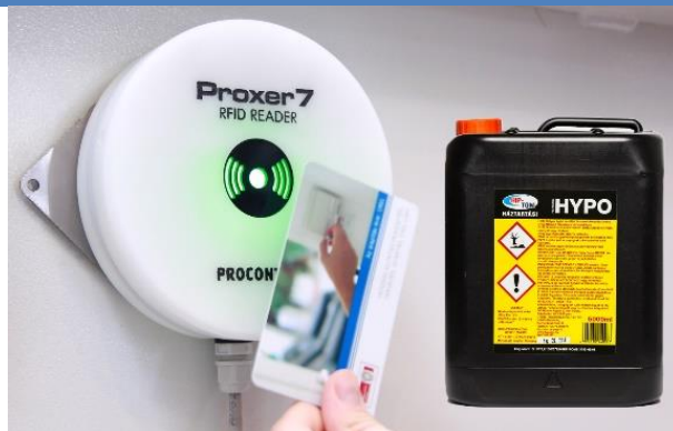
IP67 védettségű osztályú tokozás POM anyagból, vegyszerálló, gyenge savaknak és erős lúgoknak is ellenáll, befoglaló mérete: D120x34 [mm] Lásd bővebben a Proxer7-S leírásában